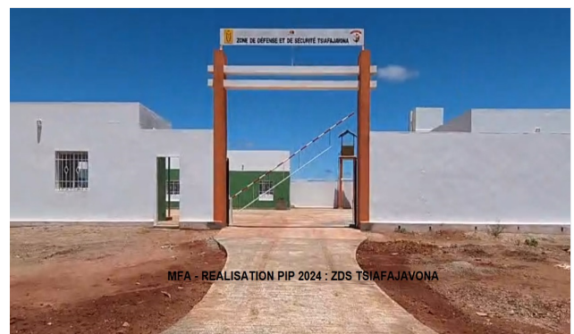
MFA - REALISATION PIP 2024 : ZDS TSIAFAJAVONA